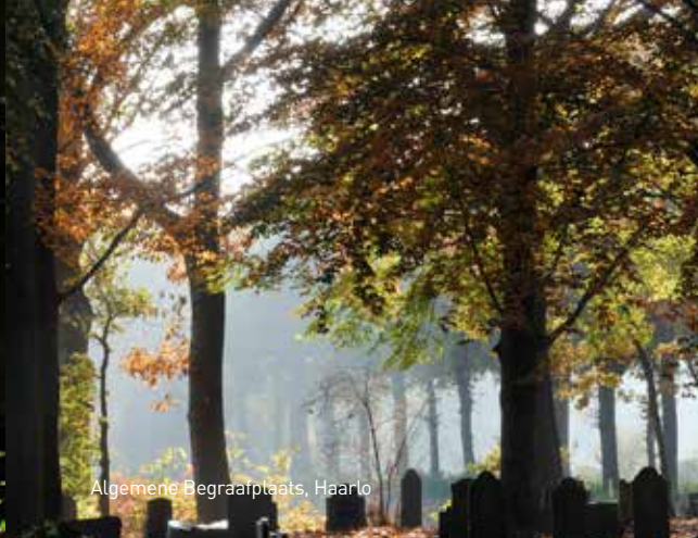
Algemene Begraafplaats, Haarlo