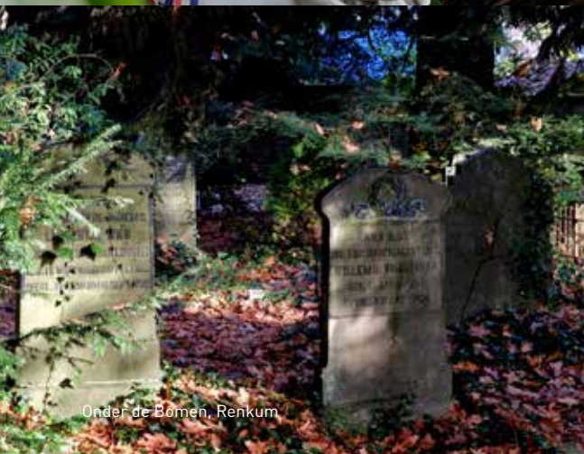
Onder de Bomen, Renkum